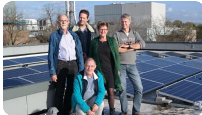
Zon Delen in Berkelland & Duurzame Energie Eibergen