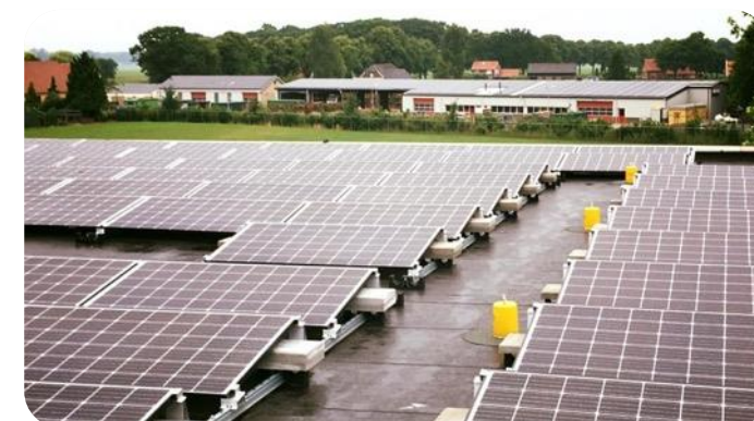
De Zonders Beltrum